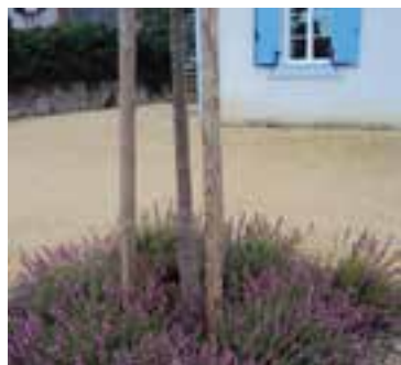
Pied d'arbre planté