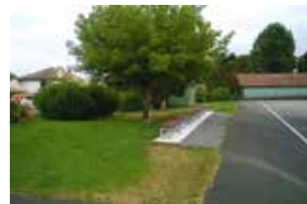
Espace bourg côté fronton

Code 2 : espaces d'accompagnement aux abords et derrière la mairie, autour de la salle polyvalente et de l'église.