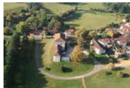
Vue aérienne du Château d'Aon

Le passage au « tout thermique » a suscité quelques difficultés les trois premières années. La surface à entretenir sur la commune de Hontanx est en effet conséquente (2 cimetières, 1 stade, le tour de l'étang, 3 lotissements) et le désherbage thermique à flamme nécessite de nombreux passages en particulier au cours des trois premières années de mise en service.