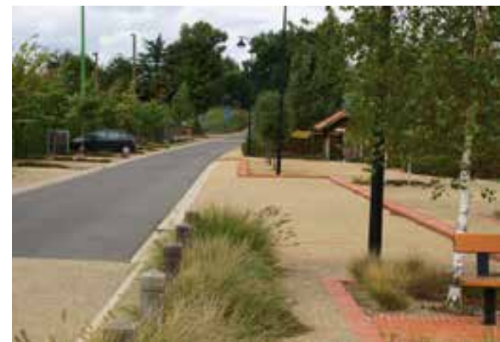
Route du lotissement

➔ L'implication des élus de la municipalité de Hontanx a été décisive pour mettre en œuvre ces projets mais aussi pour les expliquer et accompagner leur appropriation par les usagers.