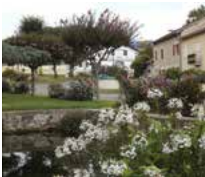
Abords du lavoir