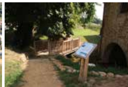
Sentier de découverte

Mais, au fil des années, les agents se sont organisés : ils ont développé d'autres méthodes alternatives comme le paillage, les plantes couvre-sol ou le désherbage mécanique et ont petit à petit laissé la place à quelques adventices souvent bien acceptées par la population.