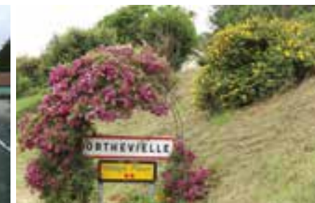
Entrée de bourg

✓ Tonte des pelouses toutes les 2,5 à 3 semaines à une hauteur de 5,5 cm à l'aide de tondeuses rotatives autoportées, ramassage en saison estivale si nécessaire.