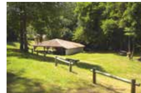
Airial et lavoir

En complément de ce matériel performant et écologique, les semis sur les trottoirs non-piétons ont été favorisés et les zones de parking aménagées en terre-pierre.