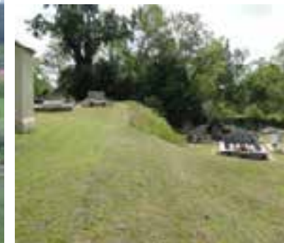
Tonte au cimetière Saint Michel